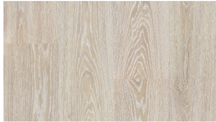
Дуб Онтарио FP09