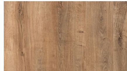
Дуб Кантри Классич. FP205