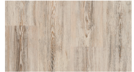
Сосна Лагерта Светлая FP200