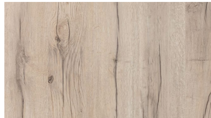
Дуб Янтарный Светлый FP204