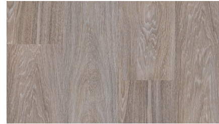
Дуб Каньон Серый FP19