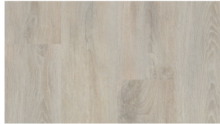
Дуб Пепельный FP11